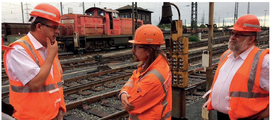
Besuch auf dem Rangierbahnhof Bischofsheim

Wie wichtig die öffentliche Vergabe ist, wurde beim Besuch einer Straßenbahn-Baustelle in Hannover am Steintor deutlich. Hier wurde beim Ausbau auf Kriterien der Guten Vergabe geachtet. Die öffentliche Hand gibt derzeit ca. 400 Milliarden Euro für die öffentliche Beschaffung von Gütern und Dienstleistungen aus. Dies entspricht etwa 17% des Bruttoinlandsproduktes und unterstreicht die große Vorbildrolle des Staates. Dieser darf sich nicht allein von privatwirtschaftlichen Kostenüberlegungen leiten lassen, sondern muss Preisunterbietung durch Lohndumping einen Riegel vorschieben und die hiesigen arbeits- und sozialrechtlichen Standards stärken.