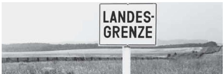
Bald auch für Arbeitnehmer aus (fast) ganz Europa nur noch ein symbolischer Hinweis: Mit der Arbeitnehmerfreizügigkeit fallen auch die „Grenzen“ auf dem

Im Übrigen ein Problem, das nicht nur die Beschäftigten trifft. Auch Inhaber kleiner und mittlerer Handwerksbetriebe sollten den Stichtag 1. Mai 2011 ernst nehmen und über die Kammern und den DHKT Druck auf die Politik machen: Denn mit den Preisen, zu denen „ausländische Dienstleistungserbringer“ oder osteuropäische Zeitarbeitsfirmen und Subunternehmer arbeiten würden, könnten sie nicht mithalten. Wird in Deutschland eine untere, gesetzliche Haltelinie bei Löhnen eingezogen, schützt das auch Hunderte, vielleicht sogar Tausende Betriebe im Handwerk.