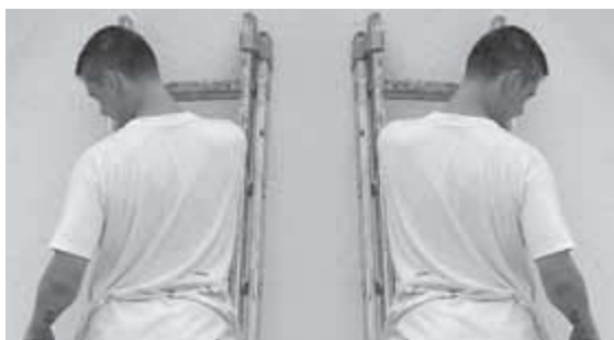
(Montage)

Gleiche Arbeit, ungleiche Bezahlung, weniger Rechte: Leiharbeiter müssen den Stammbeschäftigten endlich gleichgestellt werden, fordern die Gewerkschaften.